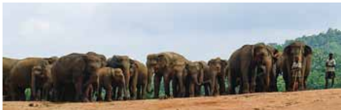
AS Dekeyser/G. Schoeters