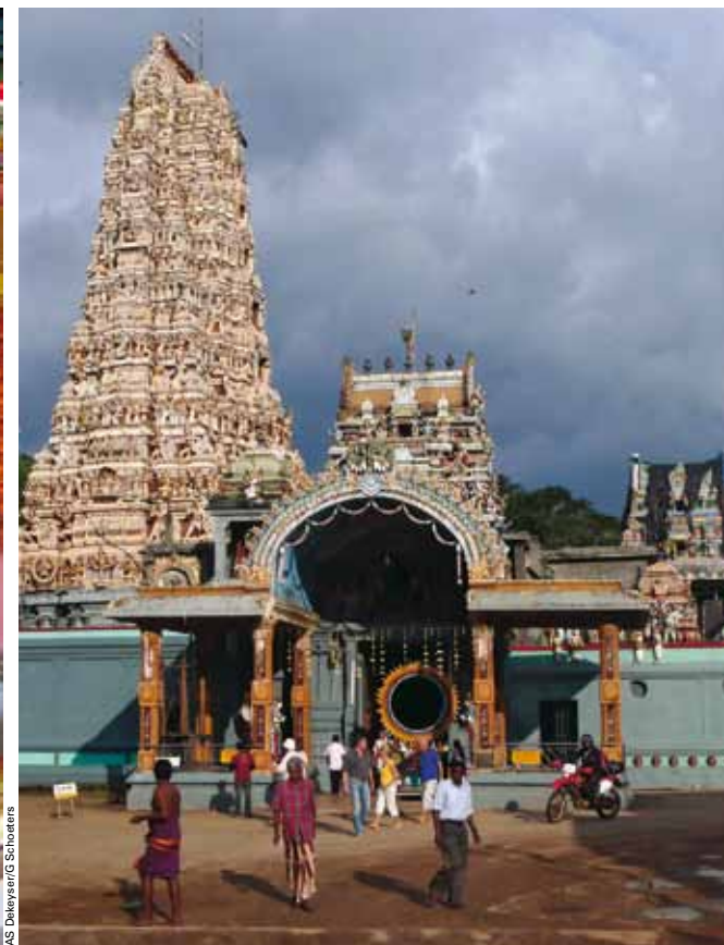
AS DeKeyser/G. Schoeters