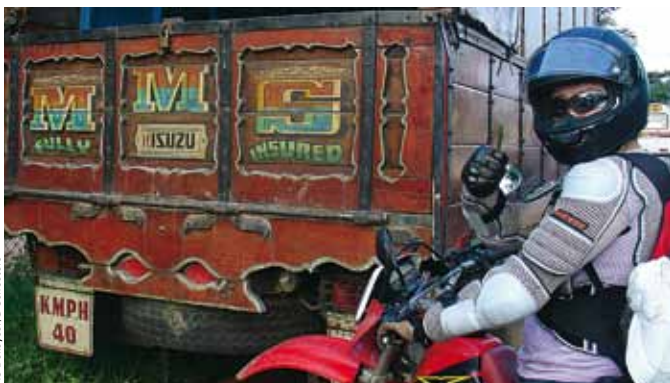
AS Dekeyser/G. Schoeters

de bocht gemist en ligt een paar tientallen meters lager in de jungle. We hebben hem net gemist. We mogen van geluk spreken dat ze hier vier religies hebben, en dat al die goden een beetje over ons waken. Van in zijn weggappelletje kijkt Sint Sebastiaan hoofdschuddend toe. Als dat maar goed komt. Zijn bezorgdheid is terecht, want op dit laatste stuk weg hebben we niet langer genoeg aan boeddhistische kalmte en Vishnu's zegen om in één stuk aan te komen; dit wordt toch weer heel erg inch'allah driving .