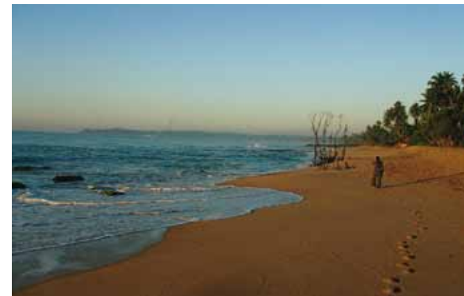
AS DeKeyser/G. Schoeters