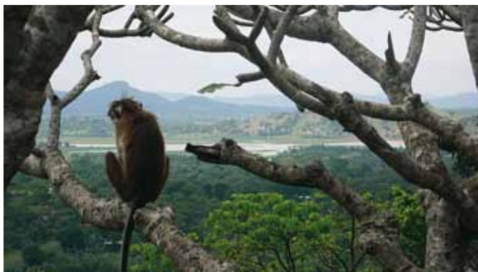
AS Dekeyser/G. Schoeters