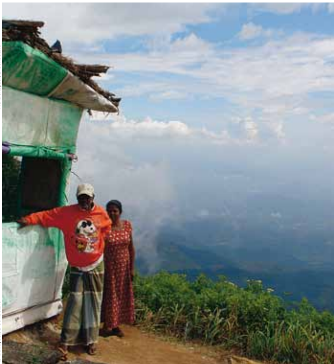
AS Dekeyser/G. Schoeters