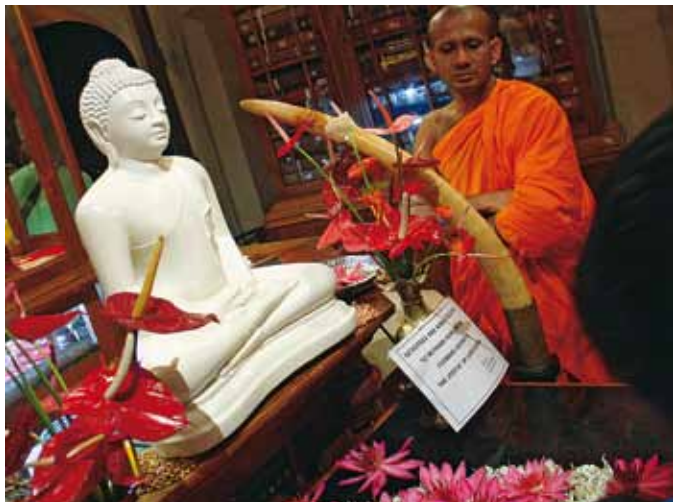
AS Dekeyser/G. Schoeters