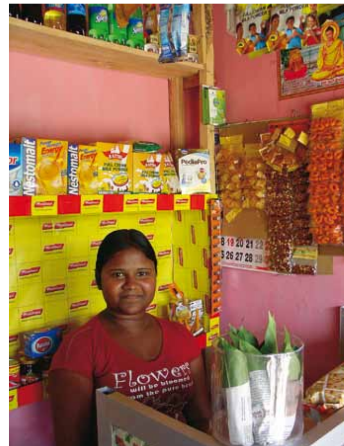
AS DeKeyser/G. Schoeters

De volgende ochtend gaan we vroeg op pad; ik wil absoluut de grote hoofdbanen vermijden, zeker als we wat dichterbij Colombo komen. Want de nabijheid van de hoofdstad laat zich duidelijk voelen: het verkeer is al de hele dag een pak slechter dan voordien. Bussen vliegen op het tegenoverliggende rijvak blinde bochten in, auto's proberen toch nog in te halen en duwen ons in de berm als dat net niet blijkt te lukken... het is dan ook een kwestie van tijd voor het eerste ongeval; een jeep heeft