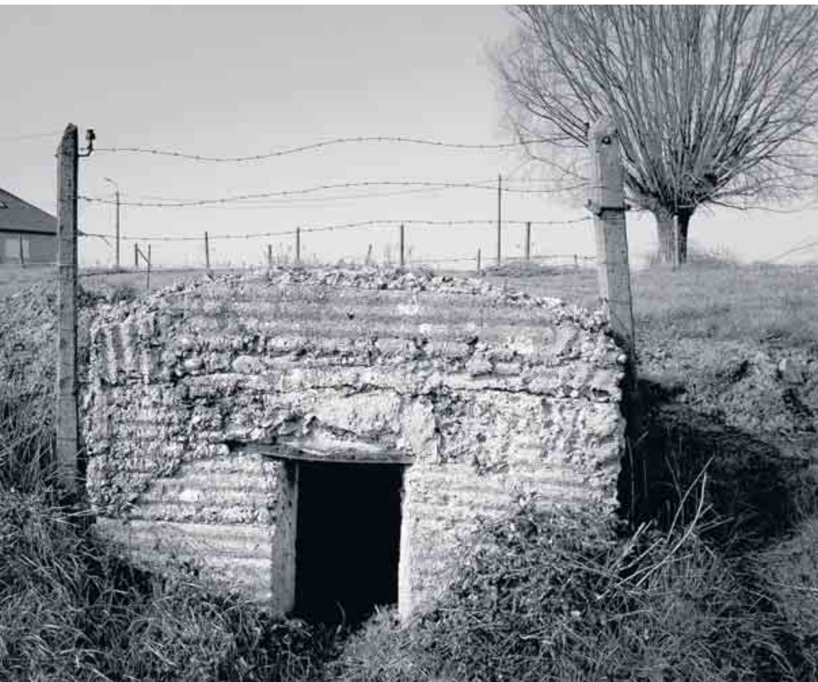
Een bunker uit de Eerste Wereldoorlog in Zonnebeke.

DE AUTEUR: journaliste en scenariste die al een reisboek op haar naam heeft.