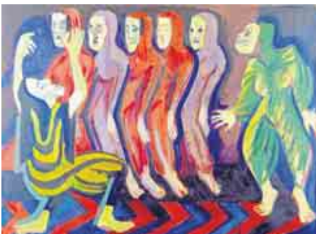
'Totentanz der Mary Wigman', 1926-1928, Ernst Ludwig Kirchner.