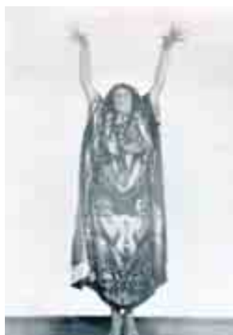
'Mary Wigman danst "Hexentanz"', 1926.