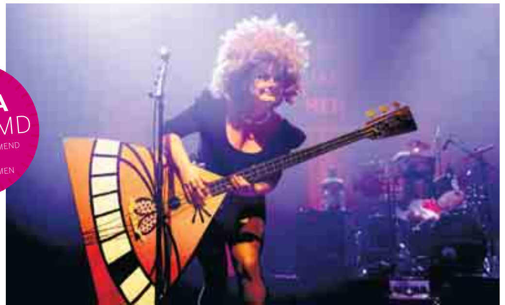
Opvallen met een reuzenbalalaika.