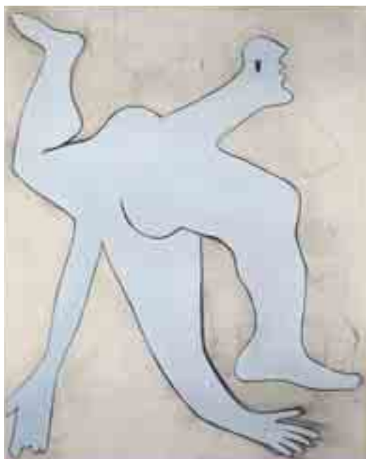
'L'acrobate bleu', 1929, Pablo Picasso. © Succession Picasso