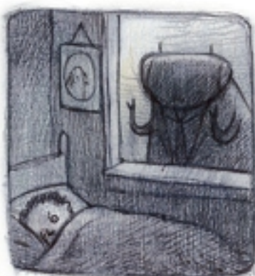
wakker worden van het geluid van een eenzame viande.