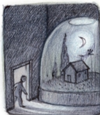
nog steeds nacht, volgens de sneeuwbal: terug naar bed!