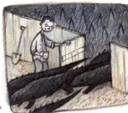
de leguanen terug binnenlaten en nadenken over morgen.