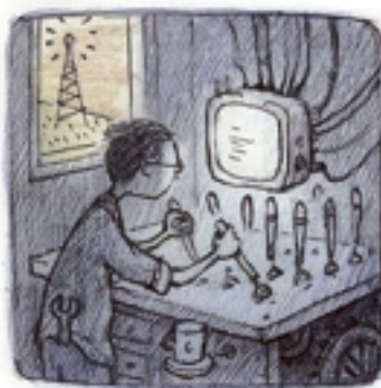
wat e-mails van drie jaar geleden beantwoorden.