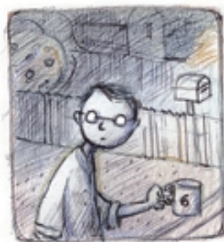
enkele uren later, aan de voordeur de koffiemachine opwachten.