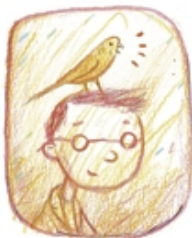
uiteindelijk een eenvoudige waarheid inszien.