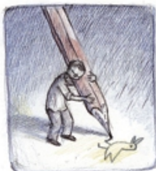
beginnen te werken aan het meest diepsinnige verhaal ooit.