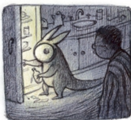
in de keuken mijn eigen bewustzijn tegen het lijf lopen - hoe laat is het?