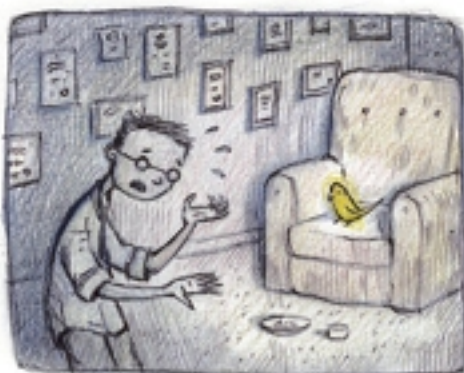
een monoloog over artistiek falen afleken in het kantoor van mijn innerlijke parkietje.