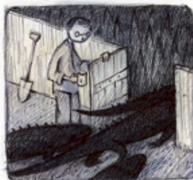
de leguanen buiten laten langs het achterpoortje.