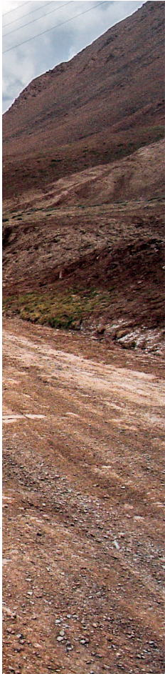
© Trui Hanouille en Gaele Schoelers