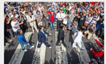
Imitators aan het werk.

Gisteren was het vijftig jaar geleden dat The Beatles Abbey Road uitbrachten, en dat zullen ze in de gelijknamige straat geweten hebben. Maar liefst 3.500 fans daagden op om zich op het legendarische zebrapad te laten fotograferen, Beatles-imitators brachten hun gitaar mee, een van hen vroeg zelfs zijn vriendin ten huwelijk op het zebrapad. (Ze zei 'ja!') Afwezig waren de nog levende Beatles Ringo Starr en Paul McCartney. Die laatste