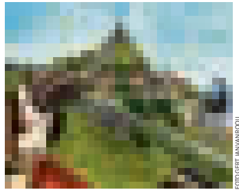
1 to 87 (2014), de modelspoorbaan van Fiona Tan, is tijdens Europalia te zien op de expositie Trains and Tracks in Brussel.