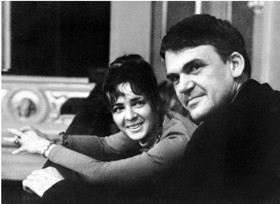
Milan Kundera poseert met zijn vrouw in Praag (14 oktober 1973).

In Kundera's werkkamer in Parijs hingen twee portretten: een foto van zijn vader, die pianist was, en een van de Tsjechische componist Janáček, bij wie zijn vader studeerde. Ook Kundera had een sterk muzikale achtergrond; daardoor benaderde hij ook zijn romans als een polyfonische compositie. Zo laat hij in Het boek van de lach en de vergetelheid een aantal verhalen samenvloeien rond een centraal thema, wat voor hem belangrijker is voor de eenheid van een boek dan één stuwend plot. Zelf noemt hij dat 'romanesk contrapunt': filosofie, narratief en droom samenbrengen tot één muziekstuk.