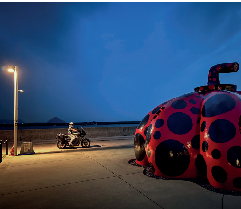
De iconische pompoen van Yayoi Kusama, op Naoshima.

begroeide poorten: torii – letterlijk ‘vogelzitstok’ – die de overgang van het alledaagse naar het heilige markeren. Nergens anders zou ik zo ontspannen ’s nachts tussen de graven dwalen, maar we hebben het Japanse veiligheidsgevoel al helemaal geabsorbeerd. In de zes weken dat we door het land rijden, zien we nauwelijks politie en er staan (gelukkig) ook bijna geen flitscamera’s en geen bewakingscamera’s. Er zijn gewoon regels en iedereen houdt zich daaraan.