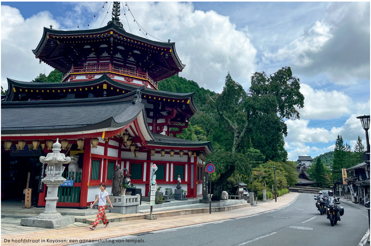
De hoofdstraat in Koyasan: een aaneensluiting van tempels.