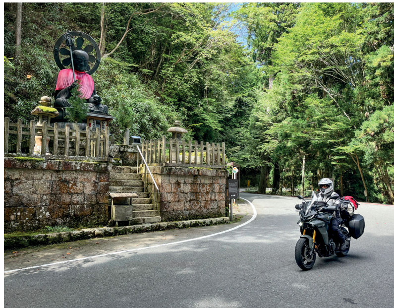
Een van de Boeddha's bij Koyasan.