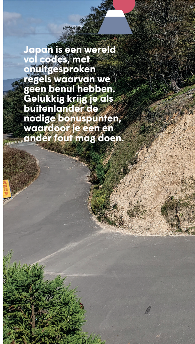
De Onyu pas: prachtige bochten, compleet verlaten.

Japan is een wereld vol codes, met onuitgesproken regels waarvan we geen benul hebben. Gelukkig krijg je als buitenlander de nodige bonuspunten, waardoor je een en ander fout mag doen.