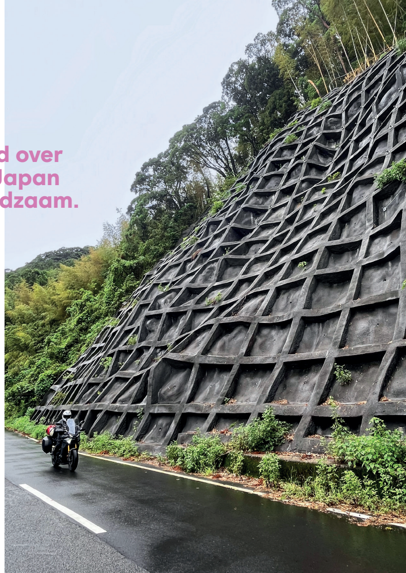
Japan is aardbevingsgevoelig, en dus zijn veel rotswanden gecementeerd om steenlawines te vermijden.

Na het avondeten worden we spontaan uitgenodigd voor een avondje sterrenkijken. Er is hier zo weinig stoorlicht dat we zelfs op een bewolkte avond de ringen van Saturnus kunnen zien. Als we licht onderkoeld terug in het hotel komen, duiken we meteen de onsen in – het warme, publieke bad.