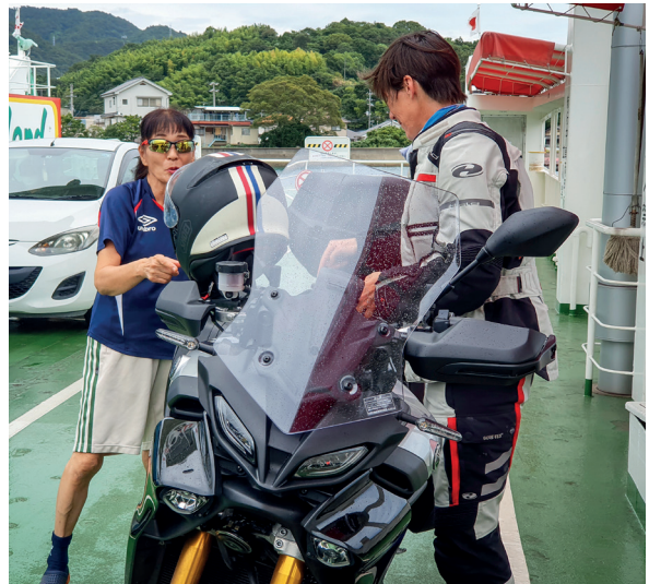
Pontje bij Setoba: een chauffeur die ongeduldig toeterde komt het goedmaken met een koekje.

Dat wij met grote motoren de baan op willen, wekt verbazing: blijkbaar zijn vrouwen op een motor hier nog eerder uitzondering dan regel.